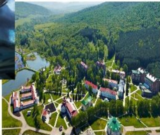
Красноусольские минеральные источники