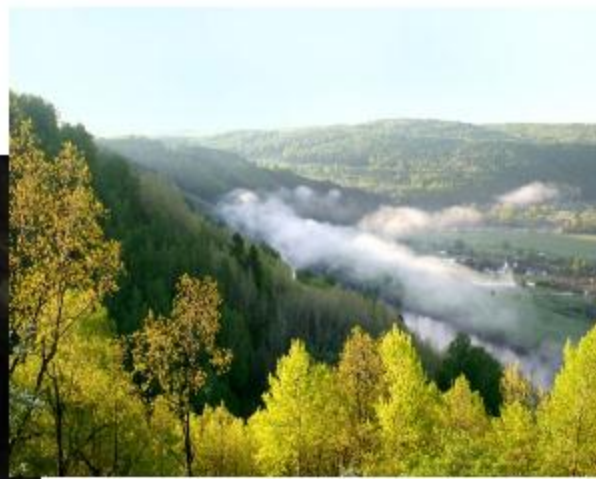
Гора Янган -тау